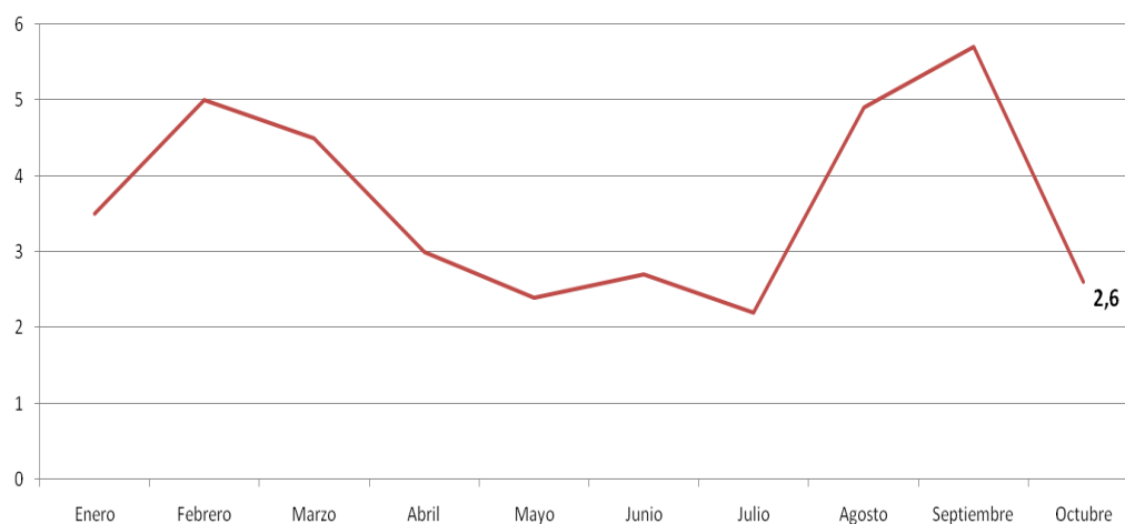
Gráfico N°1. IPCSJ - Variación porcentual mensual. Nivel general 2019.