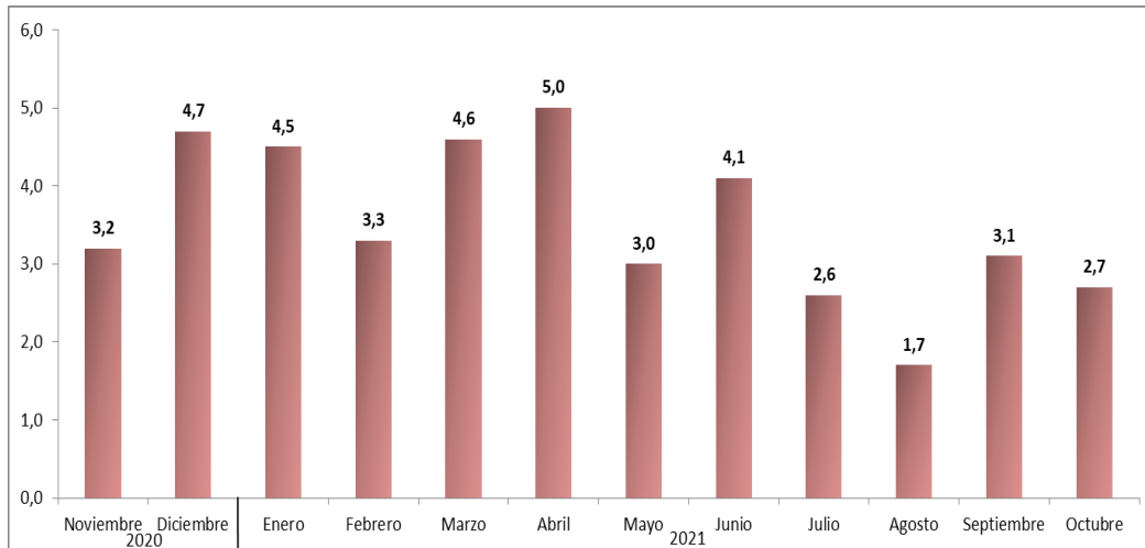
Gráfico N°1. IPCSJ - Variación porcentual mensual. Nivel general. Octubre 2021